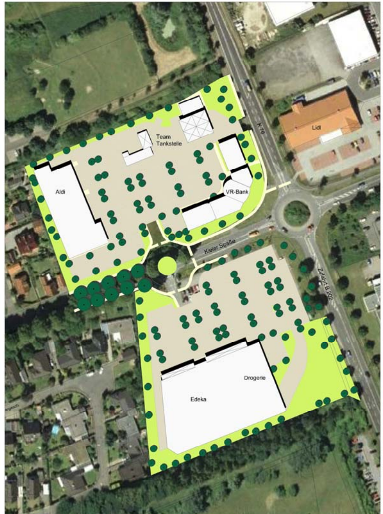
Gemeinde Osterröfnfeld: Lageplan zum Gewerbeareal am Kreisel (Stand: 13.09.2013; M. 1:1.000)

die Möglichkeit die derzeit unbefriedigende Erschließungssituation durch eine gemeinsame Erschließung des nördlich und südlich der Kieler Straße gelegenen Teils durch einen Kreisverkehr zu verwirklichen.